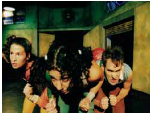
"Mendiolaza" de Krapp.

TANTTAKA TEATRO . El florido pensil. 16 octubre. YANG FENG PUPPET THEATRE . Escenas de la ópera de Pekín. 19 octubre. PASADAS LAS 4 . Baby Boom en el paraíso. 23, 25 y 26 octubre. LA ZARANDA . Cuando la vida eterna se acabe. 2 noviembre. TOMBLIGO . Balada tierna de un gamsino. 6, 8 y 9 octubre. CHICOS MAMBO