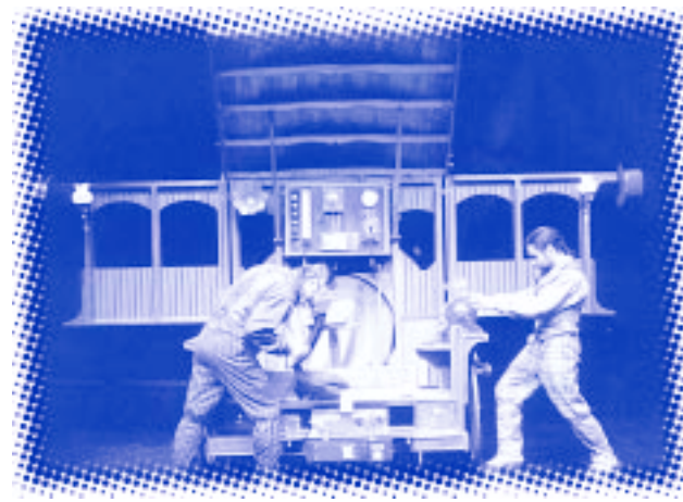
Teatro La tropa.

GEROA. Por mis muertos. 1 octubre. ESTEVE Y PONCE. Los pájaros fontaneros. 8 octubre.